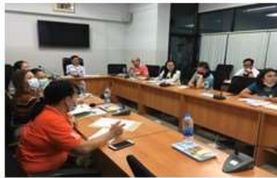
เข้าร่วมประชุม สำนักส่งเสริมสุขภาพ สำนักโภชนาการ สถาบันพัฒนาอนามัยเด็กแห่งชาติ ศูนย์อนามัยที่ 1 - 12 และสถาบันพัฒนาสุขภาพระดับเขตเมือง