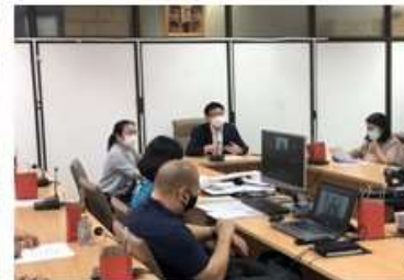
เข้าร่วมประชุม จำนวน 20 คน สำนักส่งเสริมสุขภาพ สำนักโภชนาการ สำนักทันตสาธารณสุข สถาบันพัฒนาอนามัยเด็กแห่งชาติ และภาคีเครือข่ายเล่นเปลี่ยนโลก

ที่ประชุมพิจารณาเครื่องมือประเมินผลการขับเคลื่อนนโยบาย “เล่นเปลี่ยนโลก” มีมติในการดำเนินการจัดทำเครื่องมือ แบ่งเป็น 4 ด้าน และมีนิยามในการนำไปจัดทำเกณฑ์ประเมิน ดังนี้